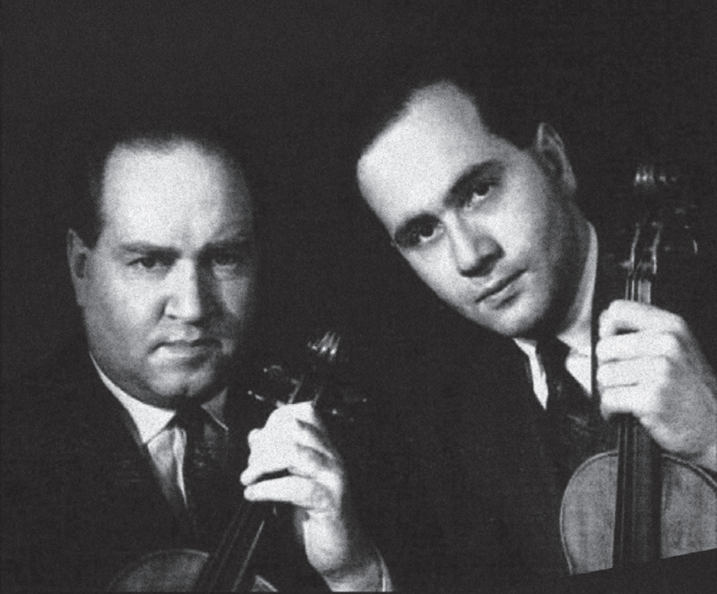
David Oistrakh, Igor Oistrakh Давид Ойстрах, Игорь Ойстрах